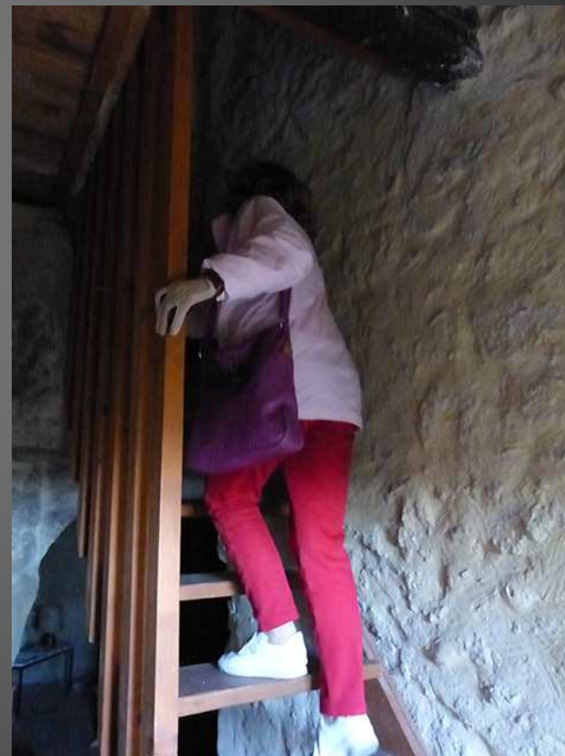
Les cavités ont été fermées par un mur de pierre percé de quelques ouvertures, on découvre ici un ancien four à pain, et là une mezzanine ...