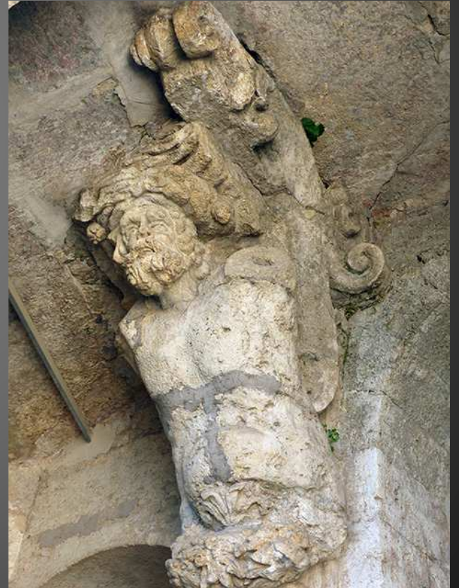
Face à nos deux Atlantes et au-delà du grand portail, un petit Eros a chu de son piédestal et sombré dans le bassin du parc, tout un symbole ...