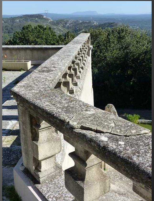
Depuis la terrasse de l'Abbaye, la vue vers le Sud est dégagée et par temps clair, se détache sur l'horizon la silhouette familière de Sainte-Victoire immortalisée par Cézanne.