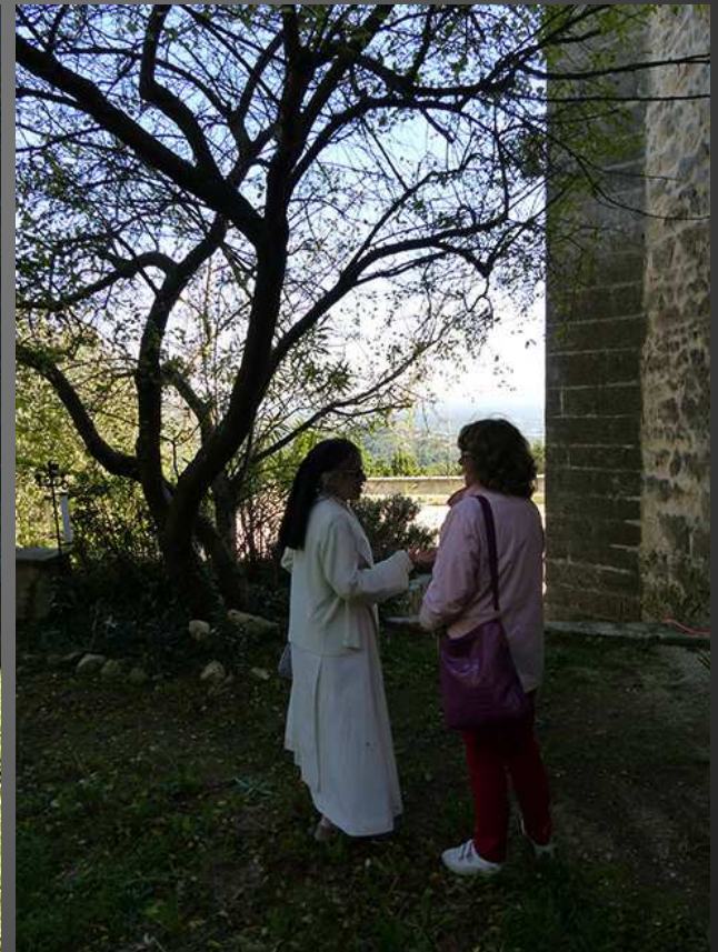
Fin de la visite dans le secteur de l'ancien ermitage, au-delà de la chapelle, un endroit propice au repos de l'esprit et à la méditation.