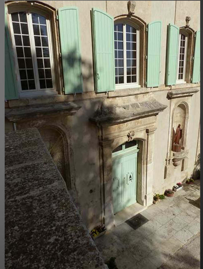
Sœur Anne-Marie fait découvrir la partie troglodytique de l'Abbaye avec ses cellules creusées dans le rocher de la falaise : les retraitants peuvent y séjourner durant l'été.