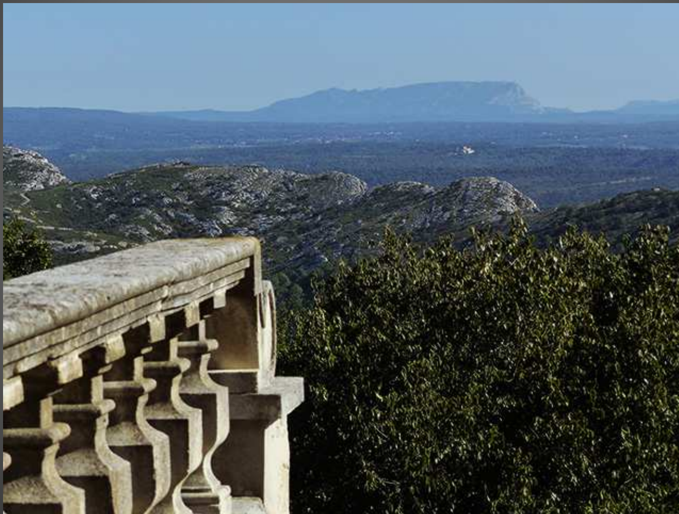
Sainte-Victoire vue depuis la terrasse de de l'abbaye Saint-Pierre-des-Canons