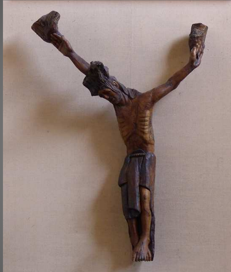
Christ en croix en bois d'olivier, dans la chapelle.