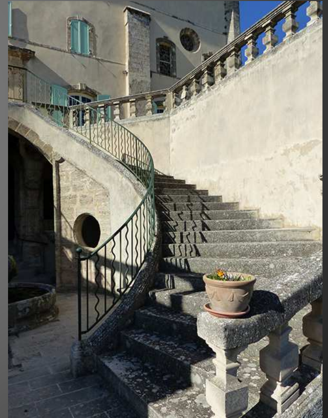
Sous la terrasse de la vaste façade Renaissance, un escalier monumental à double révolution enchâsse deux Atlantes, de la même facture que ceux de l'Hôtel de Pontevès sur le Cours Mirabeau ou du Pavillon Vendôme à Aix-en-Provence (XVIIe siècle).