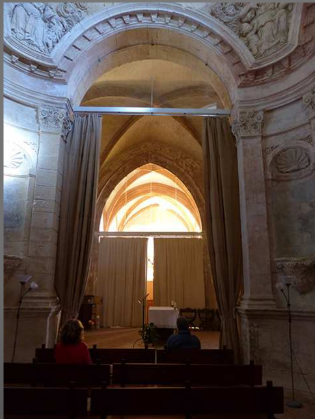
Il y avait trois visiteurs ce midi, à l'office de l'heure médiane ...