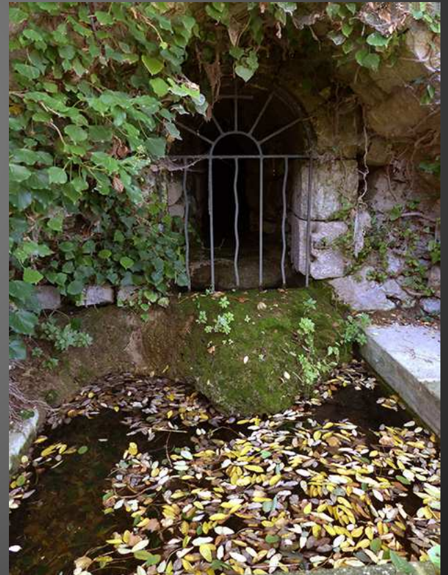
Sous un oculus, une date gravée dans la pierre et abimée par l'usage du temps, suggère le XVIII e siècle (1773 ?) _ Un peu plus loin, une source a été canalisée sous la terrasse : le « canons » de St Pierre-des-Canons fait référence aux roseaux taillés autrefois pour canaliser l'eau abondante sur le site de l'Abbaye.