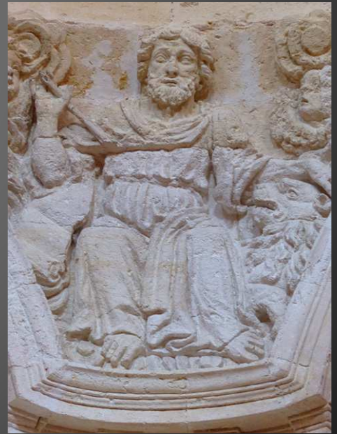
Chapelle de l'Abbaye : elle vient d'être restaurée en sa configuration d'origine par les Sœurs Dominicaines. Ici, la partie baroque - réservée aux visiteurs - est surmontée d'une coupole soutenue par les quatre Evangélistes sous leurs formes allégoriques, ( de g. à dr. : l'homme pour Saint Matthieu, l'aigle pour saint Jean, le taureau pour saint Luc et le lion pour saint Marc). Cette représentation est inspirée de la vision d'Ezéchiel (Ez 1, 1-14) et par la description des quatre vivants de l'Apocalypse selon saint Jean.